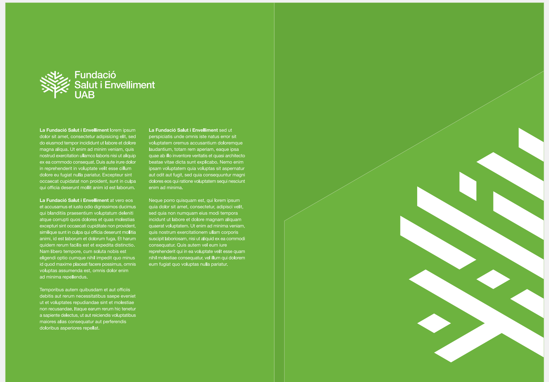
12.1. Cara i dors del folder. Disseny reduït un 50%.