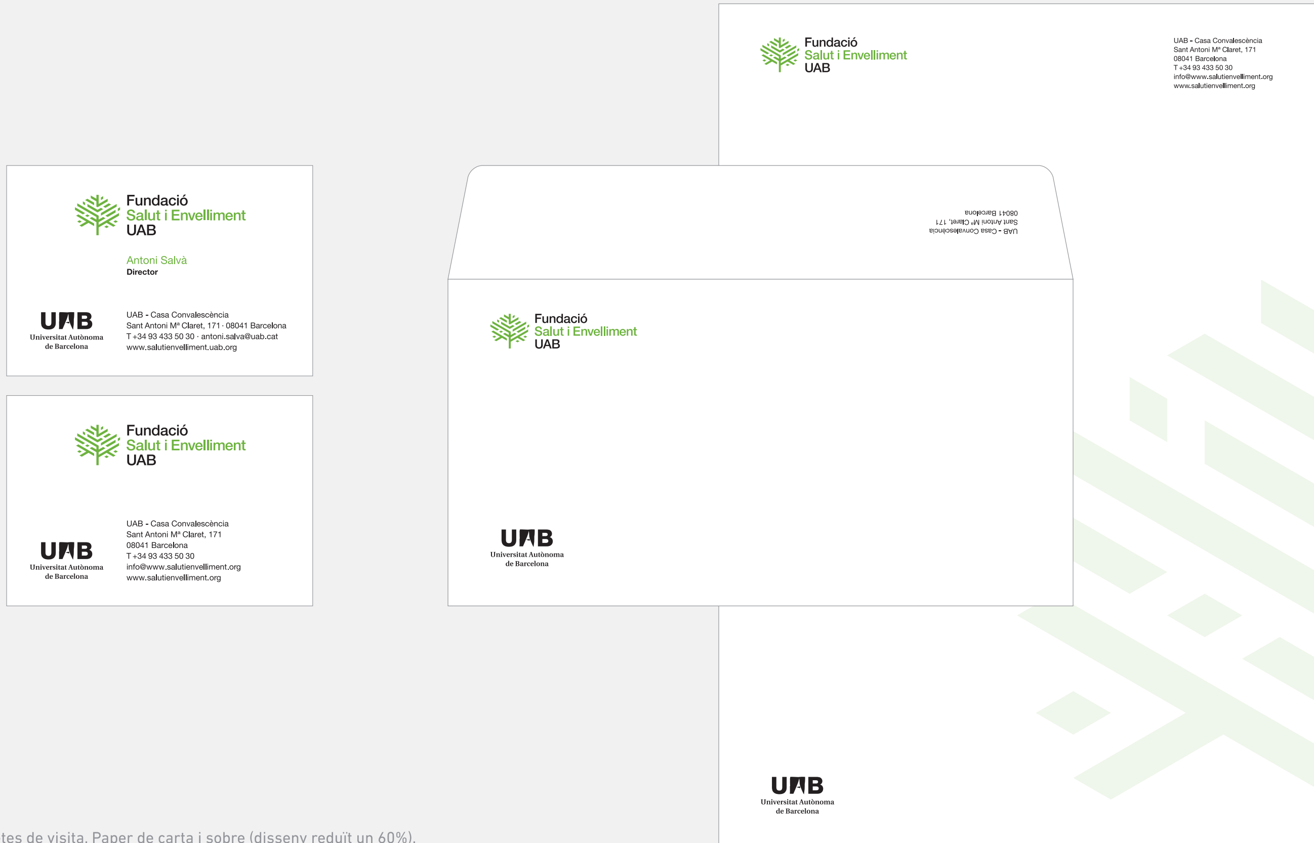
11.1. Targetes de visita. Paper de carta i sobre (disseny reduït un 60%).