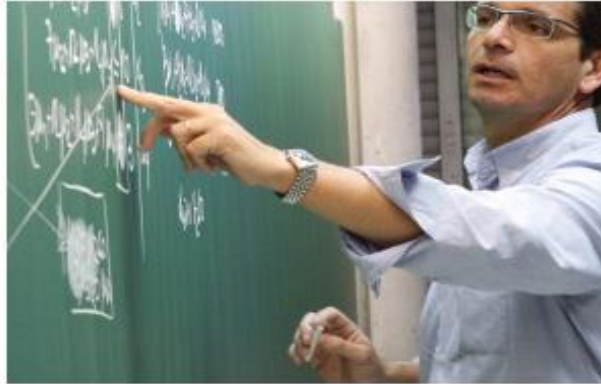
Departaments, CER, instituts i CORE