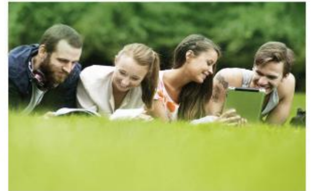
Política de recerca i transferència