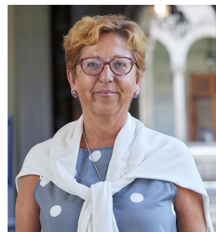
Olga Lanau, directora general del CSUC.

Espero que aquest petit document us sigui útil per valorar el camí que estem fent i, també, com no podia ser d'altra manera, per poder suggerir i fer les propostes de millora que considereu adequades.