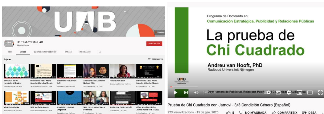
Figura 2E6. Canal Youtube del programa de doctorat: un tast d'stats

Finalment, la UAB ofereix seminaris transversal de caràcter optatiu, dels que els alumnes s'informen a través de Sigma. En ser una oferta genèrica les places es cobreixen força ràpidament.