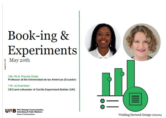
Figura 1E6. Exemple d'una activitat dels WDG

Anualment el programa de doctorat organitza sessions de treball en grup. El doctorand ha de participar durant els tres primers cursos. Els Working Doctoral Groups (WGD) aporten l'experiència amb xerrades curtes sobre la recerca d'estudiants, acadèmics i professionals (vegeu figura 1E6), que poden ajudar a la seva formació. Aquestes activitats no tenen pressupost assignat.